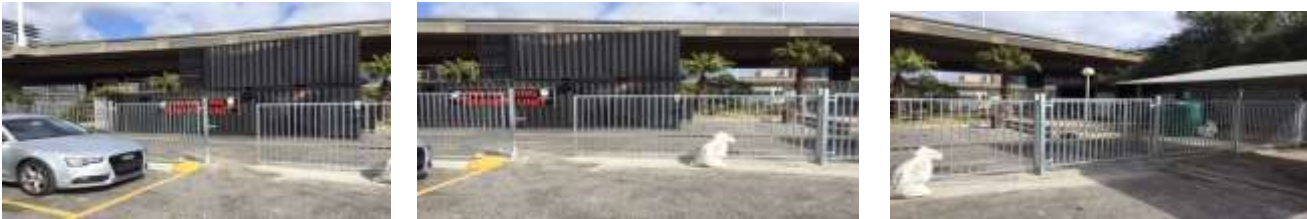
The quality of work on this gate by RMI/Reachen opened the door to more production opportunities for the Academy

Even with the depressing situation of COVID 19 it turned out to be a very good year for Reachen especially the latter part of 2020. First, we were approach by our Landlord/Strategic partner to manufacture and install a big gate on their premises.