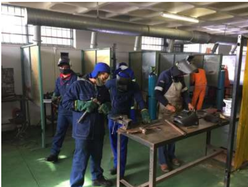
Las cursisten weer aan het werk na de onderbreking i.v.m. Corona