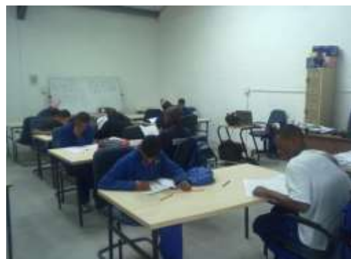
Students writing a test