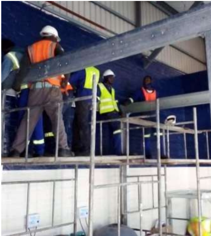
Het bouwen van een oefenplatform voor STC

Alle opdrachten dwongen groot respect af bij het management van STC en Oceana. Deze resultaten dragen flink bij aan de wens van RMI om Reachen selfsupporting te maken en RMI een betere financiële basis te verschaffen.