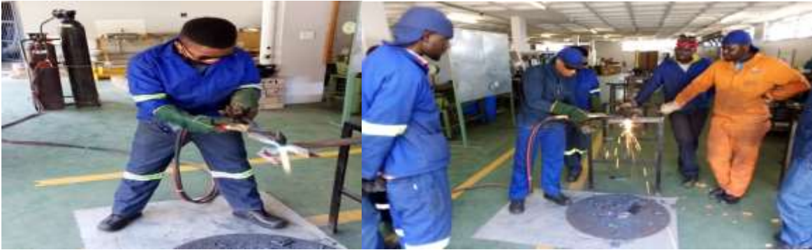
Final intake of class 2020 busy with training in the workshop in the Cape Town Harbour

The things I mentioned in the introduction, our passion to help the poor and the poorest of the poor as well as our faithful and dedicated partners in the Netherlands were the drivers to open the project on 1 July 2020. We knew it was going to be an upward battle, a swim against a very strong current, but we literally had no option. To bring hope and to keep the flame of hope alive was crucial in our fight against all these forces that were out to destroy our people. Though no trains were operating we had this believe that the tenacity and desperation of a people hungry for change will come up with a plan to get to the Academy in the Harbour.