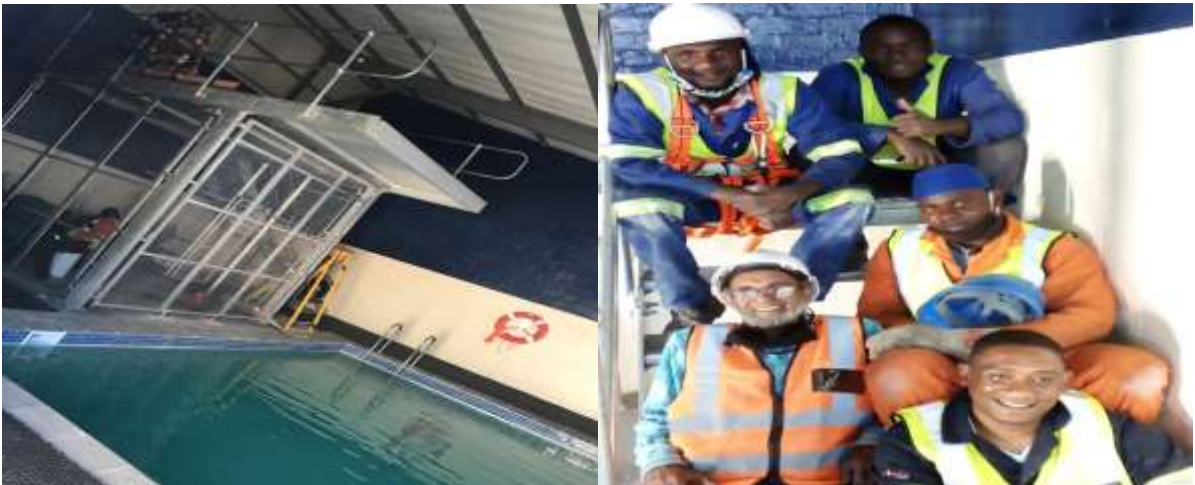
This is the completed jumping platform and the PPE cage.

The final assignment for 2020 from Oceana was for Reach Make It to build a cage for the PPE under the Jumping platform. This was another job that elicit great respect from the Management of Oceana and STC.