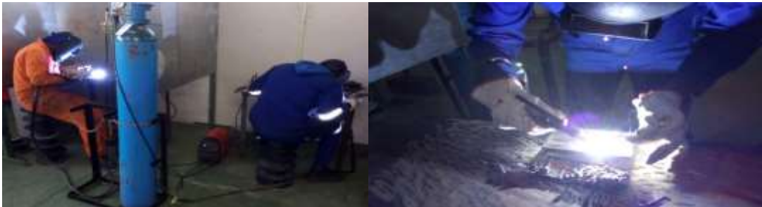
Preparation for a new life in the work world is indeed serious business. Students hard at work in the Academy

A total of 9 students registered for the last quarter. Only four completed the training in 2020 and the other five will complete the course in the first quarter of 2021 due to late registration.