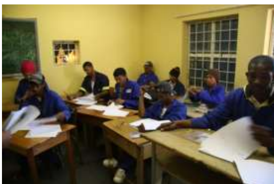
Students busy with engineering drawings